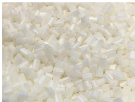
IMAGEN: Plano en detalle de Grado E